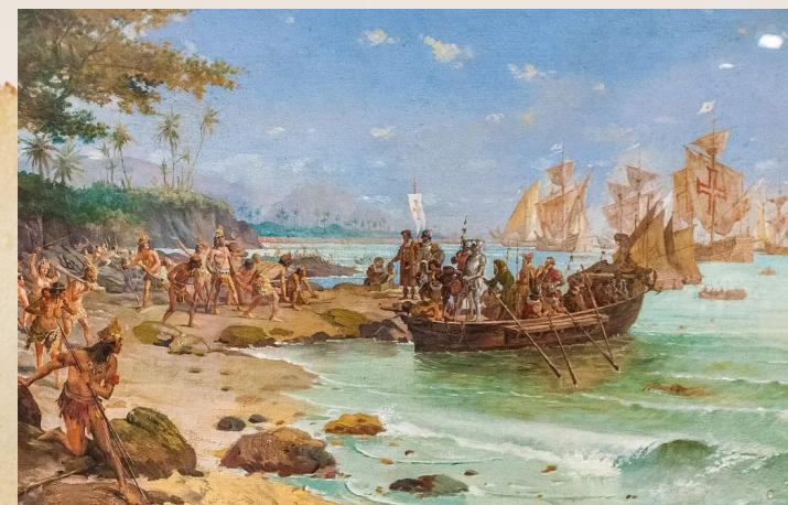
OLDRA Lucina - DN2 SRV

En avril 1500, après un changement de trajectoire vers l'ouest, l'expédition découvre les côtes du Brésil le 22 avril, qu'ils nomment «Terra de Vera Cruz». Après une exploration et quelques échanges pacifiques avec les indigènes, Cabral prend possession de la terre au nom du Portugal.